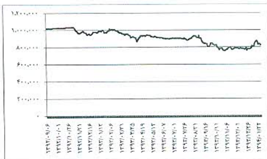
خالص ارزش دارایی هر واحد سرمایه گذاری