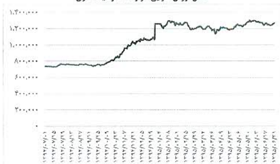
خالص ارزش دارایی هر واحد سرمایه گذاری